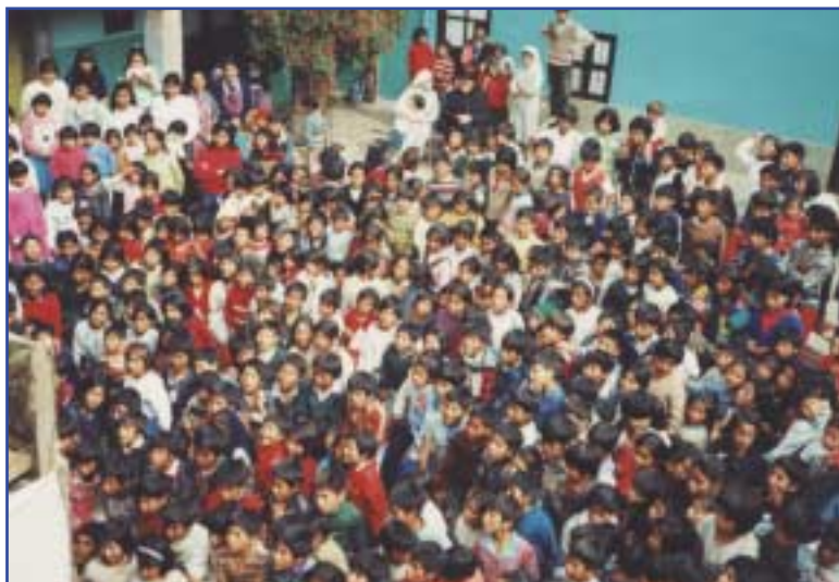
I bambini in un incontro a Cusco

Una partecipata assemblea ha dato la preferenza, a larga maggioranza, alla lista di Fiammetta Magugliani Fallabrino. Una scelta all'insegna del rinnovamento radicale dell'Associazione e del ruolo del volontariato al suo interno, che però porta in sé uno strappo profondo. La divisione è, comunque, sulle linee politiche e non sui principi che le ispirano, nel contesto di una dialettica interna vivace e possibilmente costruttiva.