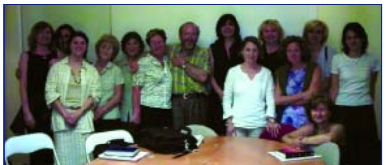
I partecipanti alla giornata

Dalla giornata di approfondimento è inoltre emersa la necessità di migliorare il supporto offerto dal NOVA alle coppie nel periodo che va dalla fine del corso all'abbinamento e quindi alla partenza, periodo particolarmente difficile in quanto la coppia arriva da un periodo molto intenso (che va dalla presentazione della disponibilità in Tribunale, ai colloqui con i servizi, la scelta dell'Ente, il corso pre-adozione, la corsa per la documentazione da inviare all'Autorità centrale nel Paese di abbinamento) e poi... ancora attesa ma questa volta vuota in cui non resta che aspettare. Questa attesa vuota il NOVA la vuole far diventare un'attesa costruttiva, un momento comunque di crescita. Il gruppo di lavoro si incontrerà nuovamente per strutturare questo ulteriore cammino con le coppie. Un successivo incontro sarà invece dedicato al supporto post-adozione.