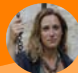
Valeria Parrella Scrittrice, drammaturga e giornalista