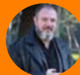
Carlo Lucarelli Scrittore, sceneggiatore e conduttore televisivo